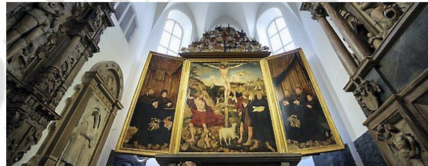
Weimar: altaarstuk van Lucas Cranach d. Ältere

Deelnemers: Het aantal deelnemers is beperkt (max. 26 personen). Inschrijving gebeurt in volgorde van opgave d.m.v. bijgevoegd formulier. Conditie / dieet etc.: dagelijks leggen we geringe afstanden te voet af. Dat vereist een normale conditie. Wanneer er bijzonderheden zijn rond uw gezondheid, dieet etc., gelieve dit dan bij opgave te vermelden.