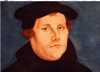
Martin Luther (Lucas Cranach d. Ältere, 1529)

De lijst van plaatsen die Luther vrijwillig of onvrijwillig bezocht, is indrukwekkend. Een aantal van deze plaatsen zullen we bezoeken om daardoor een beter beeld te krijgen van Luthers leven en beweegredenen, maar ook om ons bewust te worden van onze eigen geloofsbeleving anno 2017.